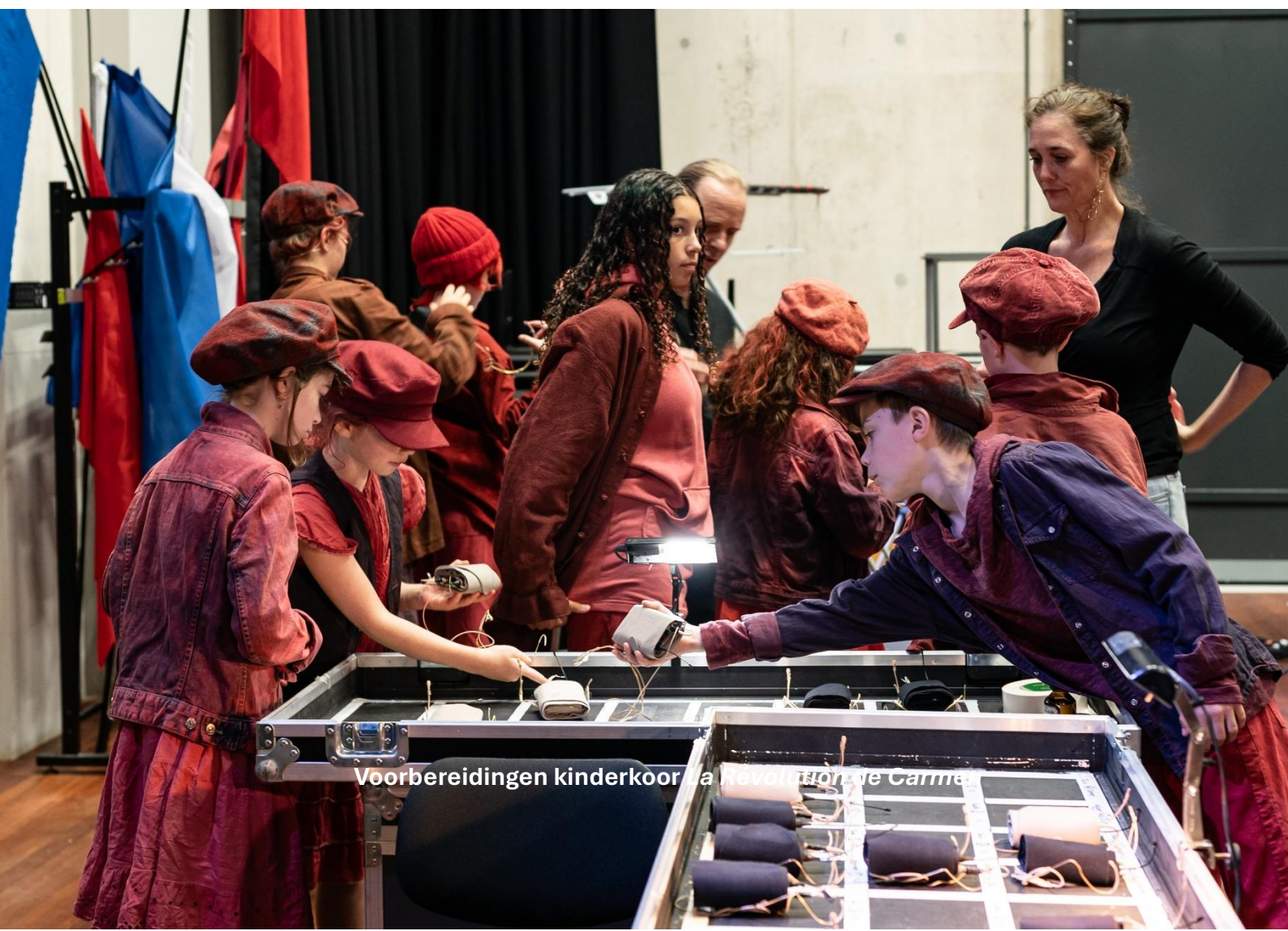
Vorbereidingen kinderkoor La Revolution de Carmel

Voor de voorstellingen die OPERA2DAY produceert wordt het kernteam aangevuld met een tijdelijk projectteam, bestaande uit onder meer ontwerpers, zangers, musici, technici, productionele medewerkers, etc. De omvang van het team varieert al naar gelang de aard van de productie en kan oplopen tot meer dan tachtig personen, die voor een langere of kortere periode aan het project zijn verbonden. Vrijwel al deze medewerkers zijn werkzaam als zzp'er, op een productiemedewerker (0,4 fte) en regieassistent (0,6 fte) na. In dit verband worden de ontwikkelingen met betrekking tot de Wet DBA nauwlettend gevolgd. De honoraria van de freelancers worden ook getoetst aan de CAO Toneel en Dans. Daarnaast werkt OPERA2DAY regelmatig met stagiair(e)s en vrijwilligers.